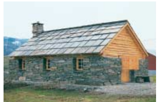
Eldhuset på Vassel.