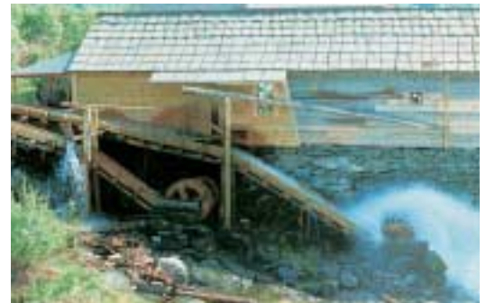
Oppgangssaga i Herand.