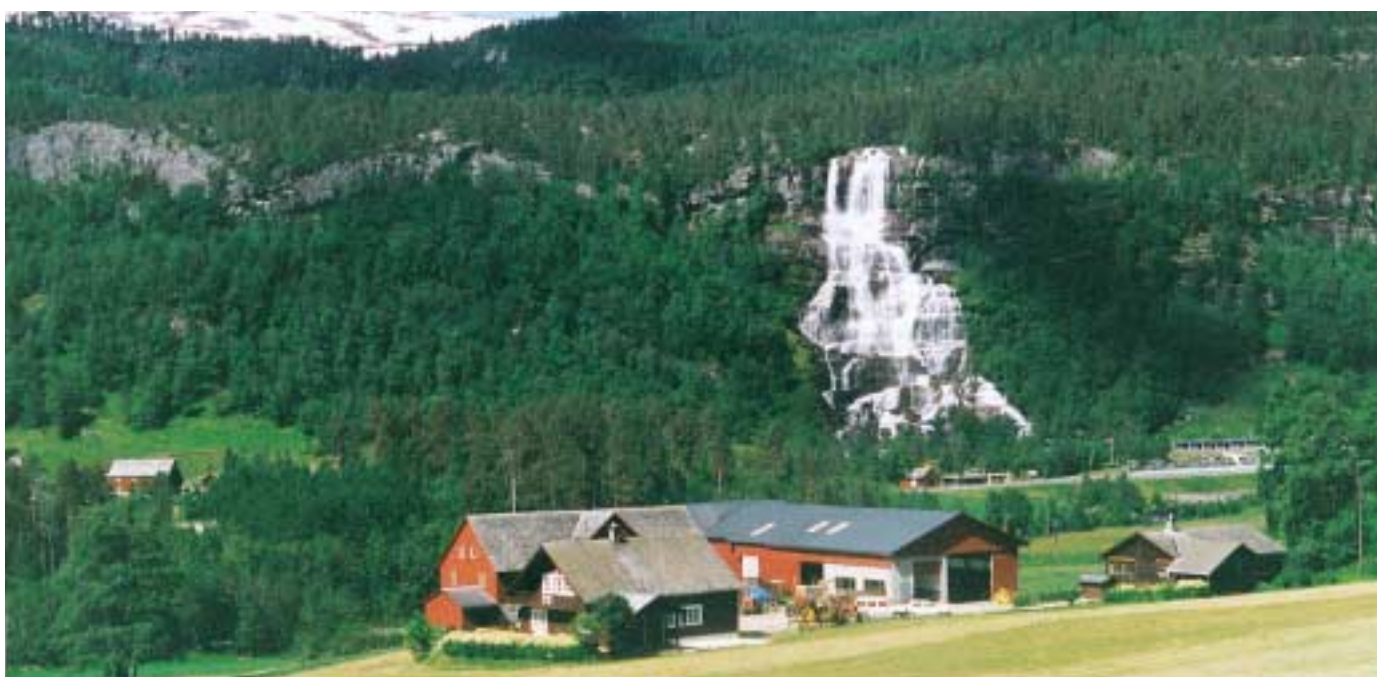
Leidal med Tvinnefossen.