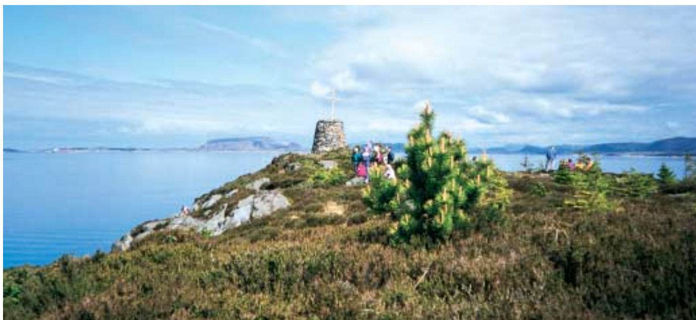
Vardetangen, Norges vestligste fastlandspunkt.